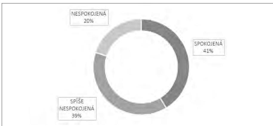
Graf 3 Spokojenost ředitelk MŠ; klastry